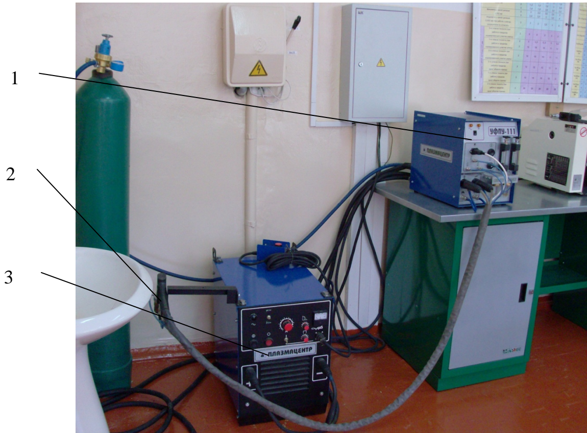
Рисунок 2 – Установка для финишного плазменного упрочнения

которую рекомендуется проводить при помощи прибора контроля качества нанесения покрытия [8]. В конце кольцо ОПУ снимается со стенда.