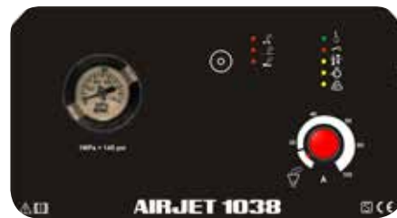
Панель управления Airjet 1038