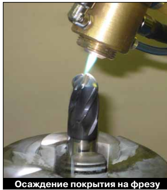
Осаждение покрытия на фрезу

Цель ФПУ – изготовление инструмента, штампов, пресс-форм, ножей, фильер, подшипников и др. деталей машин со